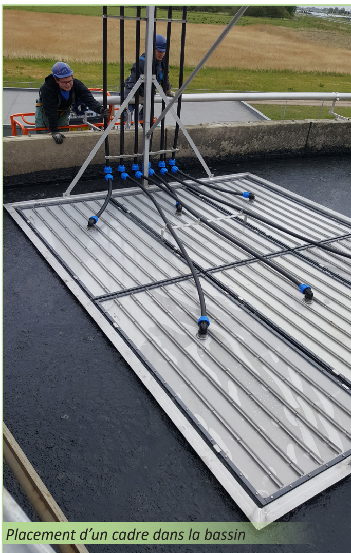
Placement d'un cadre dans la bassin