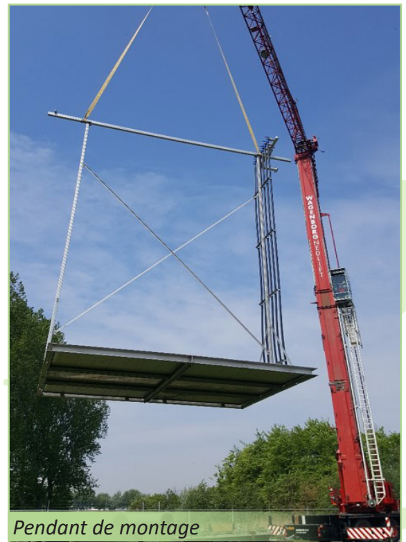
Pendant de montage