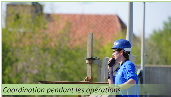
Coordination pendant les opérations

Une planification méticuleuse a été nécessaire afin de s'assurer que le système en fonctionnement soit toujours capable d'assurer une quantité suffisante d'oxygène lors de la phase de conversion, il était donc nécessaire de bien coordonner les phases de démolition de l'ancien système avec l'installation des nouveaux panneaux.