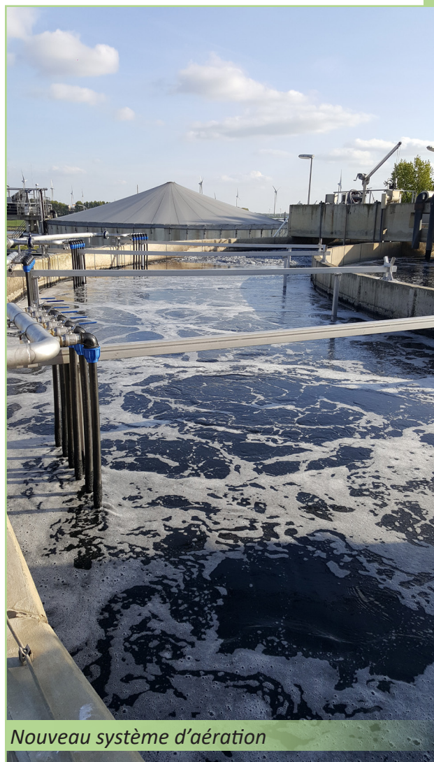
Nouveau système d'aération