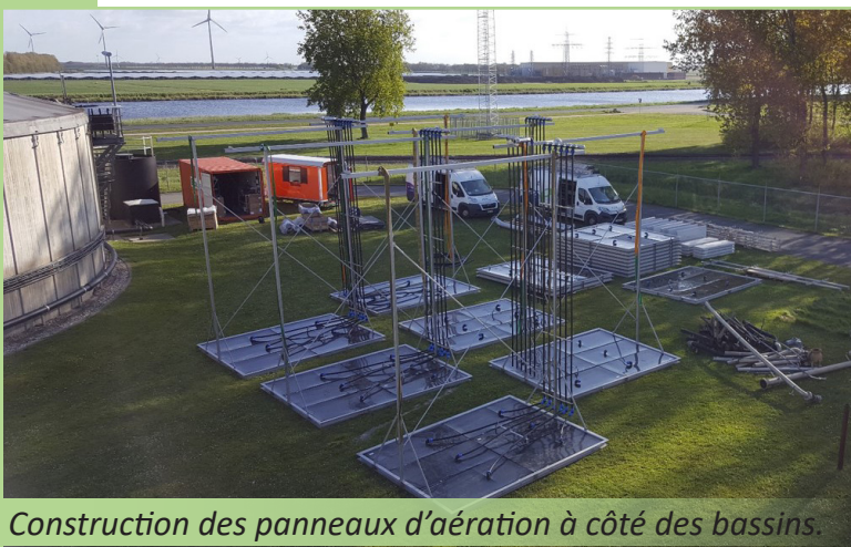
Construction des panneaux d'aération à côté des bassins.