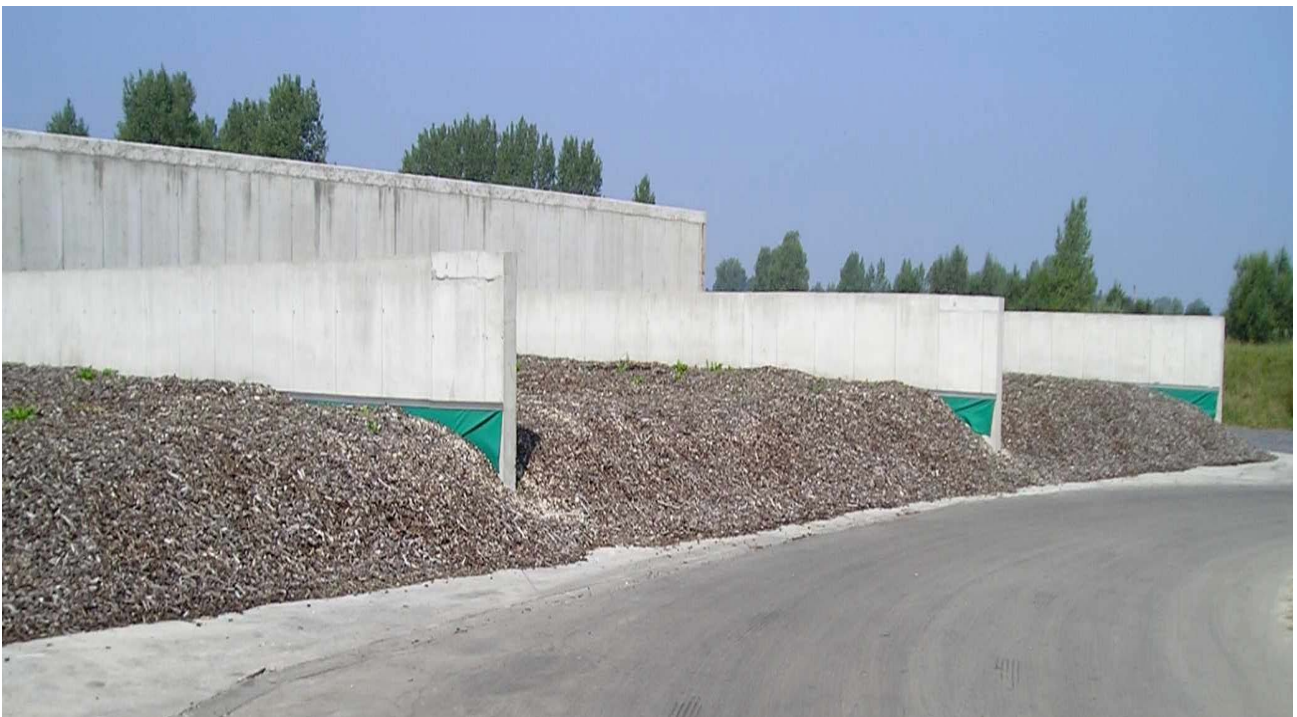
Foto: Full-scale biofilter

Wij wensen u een mooi en zonnig voorjaar toe, Het Trevi-Team